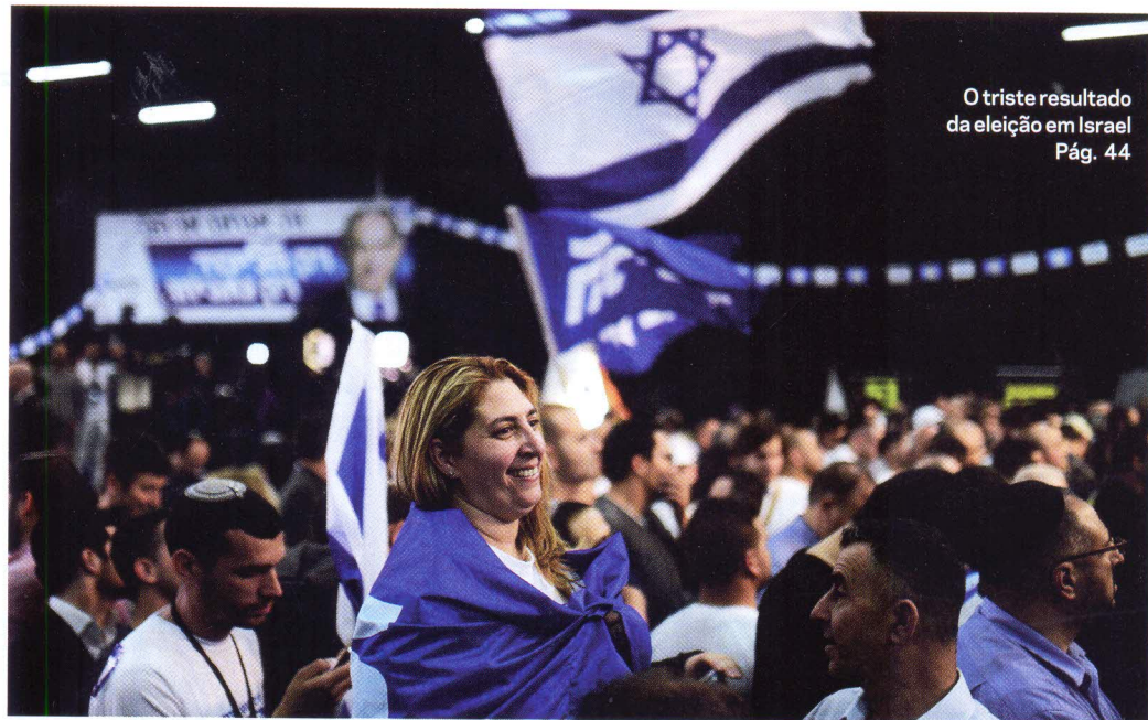
O triste resultado da eleição em Israel Pág. 44