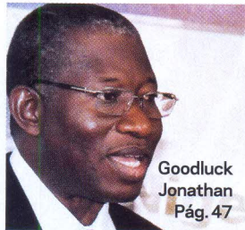
Goodluck Jonathan Pág. 47

44 ISRAEL Benjamin Netanyahu vence as eleições parlamentares pela quarta vez