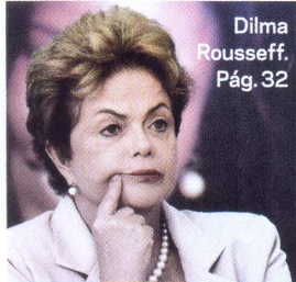
Dilma Rousseff. Pág. 32

32 PODER O Conselho criado por Lula pode ser extinto por Dilma Rousseff