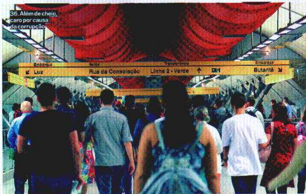
36. Além de cheio, o metrô ficou caro por causa da corrupção