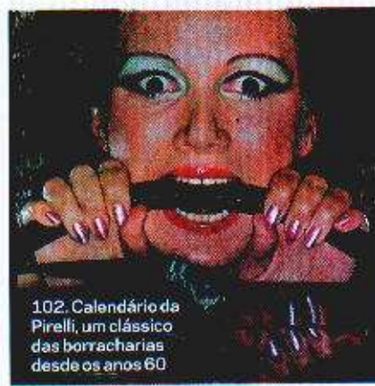
102. Calendário da Pirelli, um clássico das borracharias desde os anos 60

53 GIGANTES E INCONTROLÁVEIS AS GRANDES CIDADES CONTINUAM A DESAFIAR OS GESTORES PÚBLICOS