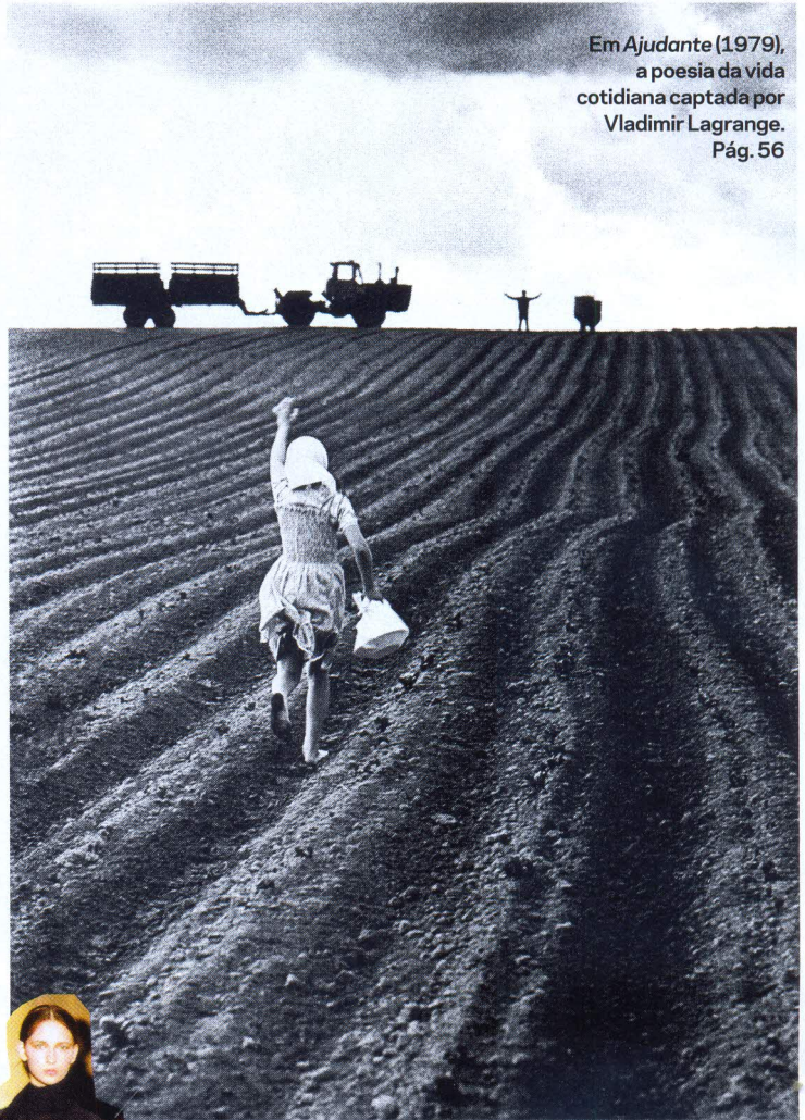
Em Ajudante (1979), a poesia da vida cotidiana captada por Vladimir Lagrange. Pág. 56

65 A MANUFATURA DE SORRISOS TESTINO É O REQUINTE DA ICONOGRAFIA ÁULICA 69 SAÚDE Por Drauzio Varella 70 ESTILO Game of Thrones dita a moda 71 PAPIÑO GOURMET por Marcio Alemão 72 AFONSINHO 73 O SOM DA IMAGEM Por Oliviero Pluviano