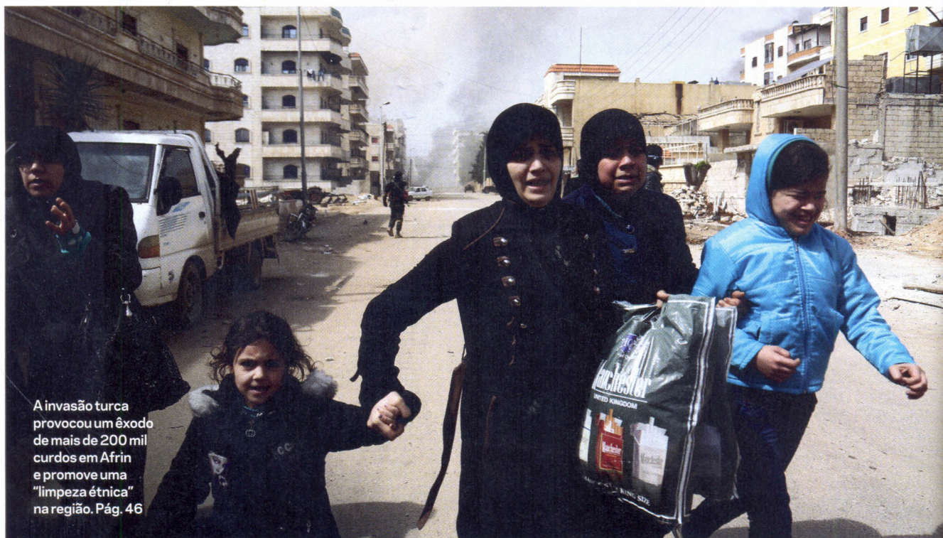
A invasão turca provocou um êxodo de mais de 200 mil curdos em Afrin e promove uma "limpeza étnica" na região. Pág. 46

10 BRASILEIRA A disputa por uma reserva na Caatinga