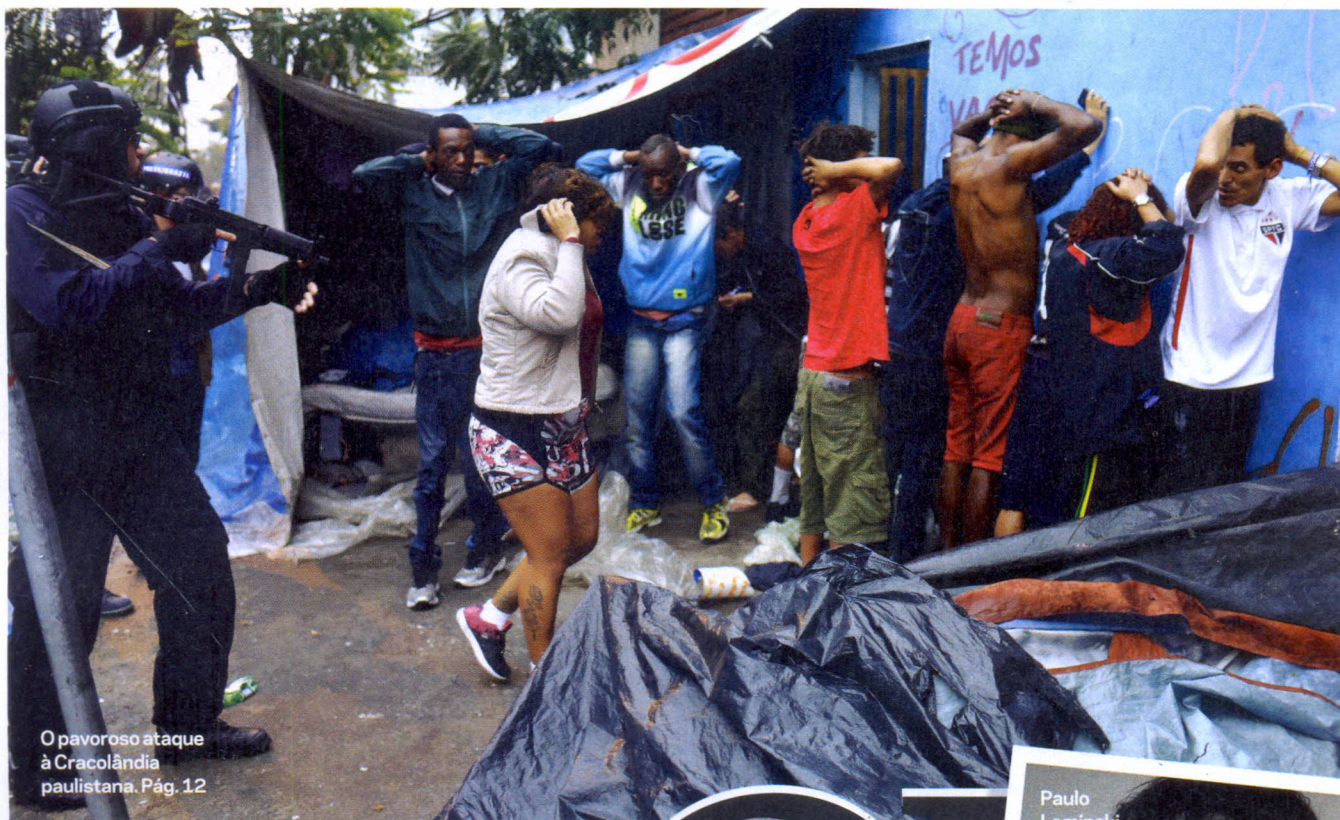
O pavoroso ataque à Cracolândia paulistana. Pág. 12

8 FRANCESA Entre festas e promoções de marcas, uma batalha contra o avanço da Netflix