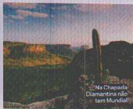
Na Chapada Diamantina não tem Mundial

CENTRAL DE ATENDIMENTO DE SEGUNDA A SEXTA-FEIRA, DAS 9 ÀS 18 HORAS, EXCETO FERIADOS SP: 11 3512-8486 / RJ: 21 4062-7183 / MG: 31 4062-7183 / DF: 61 4063-7183 / DEMAIS LOCALIDADES: 0800 721-3020 FALE CONOSCO: WWW.ASSINANTECARTACAPITAL.COM.BR