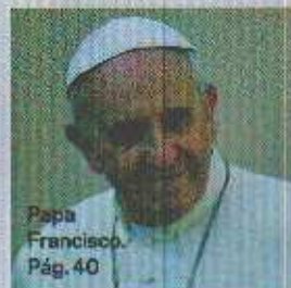
Papa Francisco. Pág. 40

44 SOCHI Os Jogos Olímpicos diminuem os protestos na Rússia