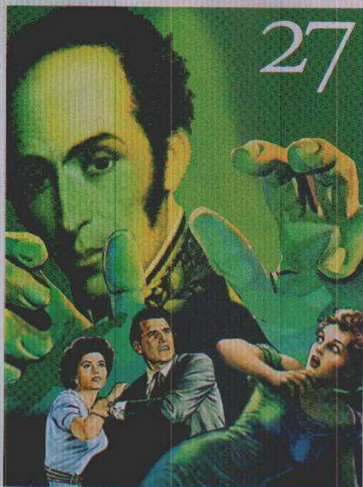
CAPA: Ilustração: Kauê Garcia