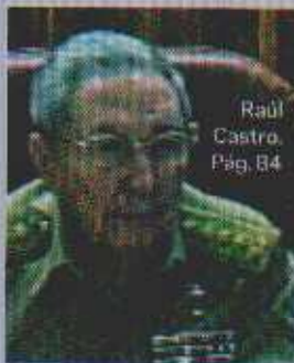
Raul Castro. Pág. 84