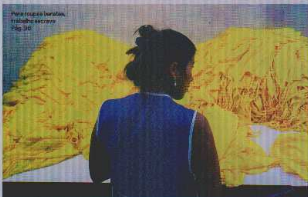
Para roupas baratas, trabalho escravo Pág. 38

68 O JUDAÍSMO E OS DIREITOS Israel perpetua o projeto oficial para se tornar um Estado Judeu