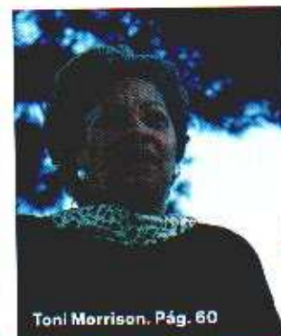
Toni Morrison. Pág. 60