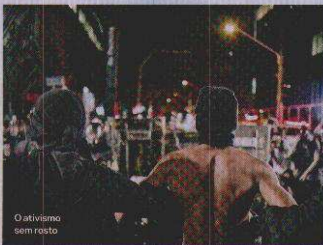
O ativismo sem rosto

FALE CONOSCO: www.ass.nantecartacapital.com.br