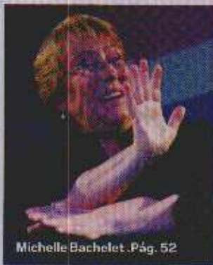
Michelle Bachelet, Pág. 52