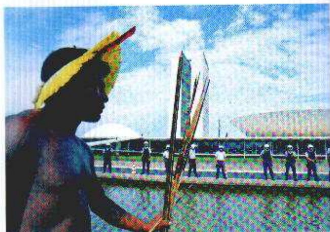
44. Até os índios protestam