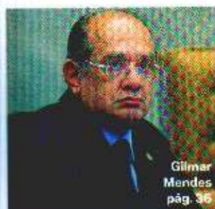
Gilmar Mendes pág. 36