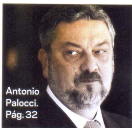
Antonio Palocci. Pág. 32

32 GRAMPOS O WikiLeaks revela detalhes da espionagem da NSA no Brasil