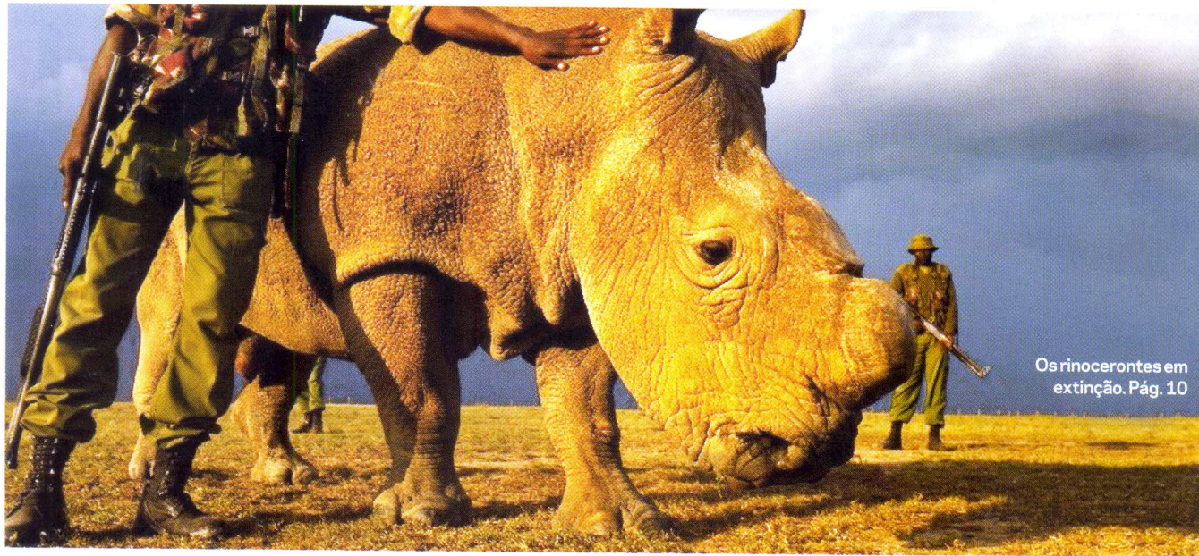
Os rinocerontes em extinção. Pág. 10