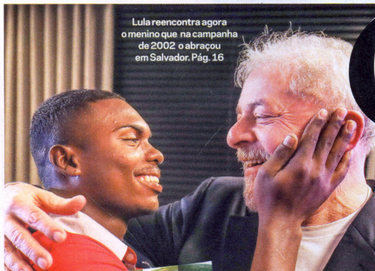
Lula reencontra agora o menino que na campanha de 2002 o abraçou em Salvador. Pág. 16