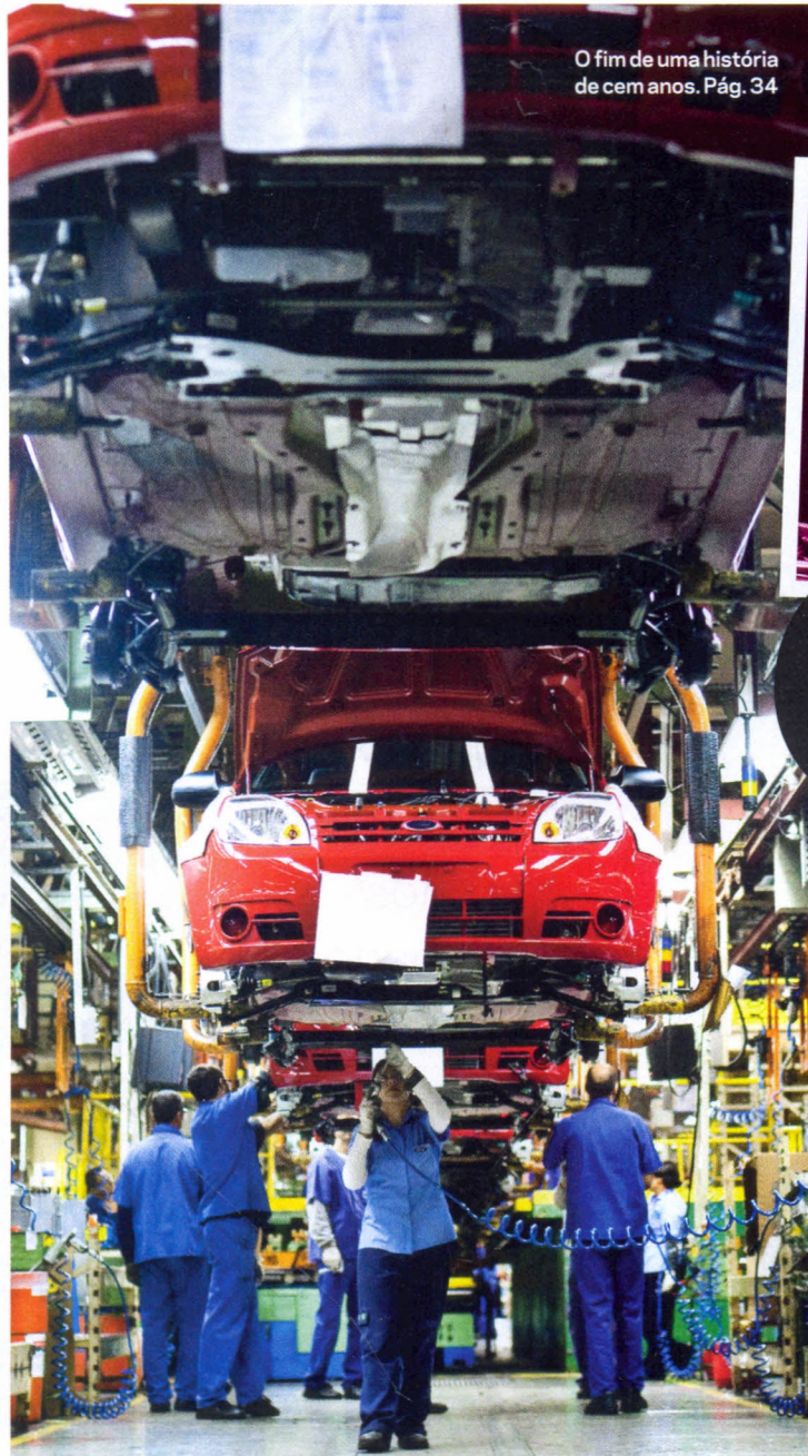
O fim de uma história de cem anos. Pág. 34

Capa: Pilar Velloso.