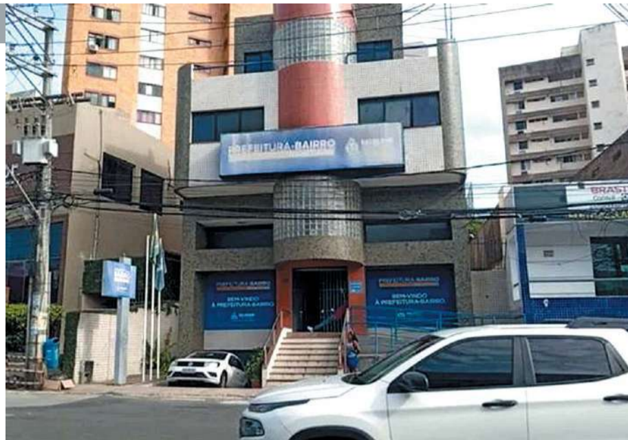
Sede da Prefeitura-Bairro Barra/Pituba foi invadida no domingo; fios de cobre foram furtados

A ocorrência foi registrada na Delegacia Virtual e encaminhada para a 13ª Delegacia Territorial de Cajazeiras. “De acordo com o registro, duas portas foram quebradas e uma