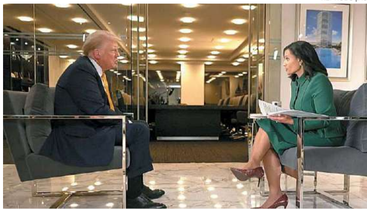
Donald Trump falou sobre os planos para mandato

PRIMEIRA ENTREVISTA O presidente eleito dos Estados Unidos, Donald Trump, disse neste domingo (8) que vai deportar todos os imigrantes ilegais dos EUA.