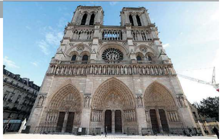
As obras de restauração tiveram duração de cinco anos

Por outro lado, se disse também disposto a negociar a situação dos “dreamers”, como são chamados os filhos de imigrantes ilegais que entraram nos EUA com seus pais quando eram crianças.