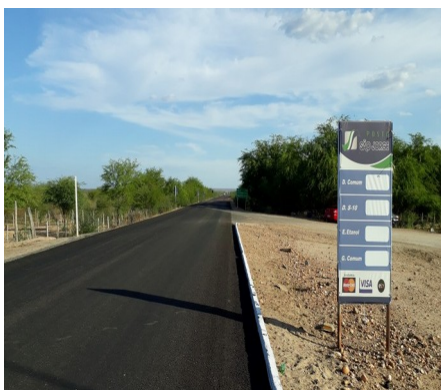
Foto 4 - Ausência de sinalização

Sinalização Vertical : Foi adotado pela Construtora o posicionamento de executar a sinalização vertical somente após serem executados os serviços de reciclagem de base, evitando possíveis avarias na sinalização já implantada, enquanto executassem estas intervenções. O projeto de sinalização vertical está sendo elaborado pela Construtora Jurema, e que está em fase de cotação e contratação para sua implantação, com previsão de implantar toda a sinalização vertical até janeiro de 2020.