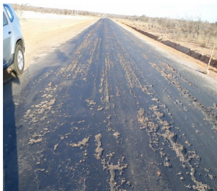
Foto 3 - Irregularidade no pavimento

Aguardando a aprovação da solução proposta por parte da SIT, a construtora optou pela imprimação do segmento, motivo pelo qual resultou na situação “bastante deteriorado” que veio a ocorrer devido a ação do tráfego. A pavimentação deste segmento será executada logo após a aprovação do projeto.