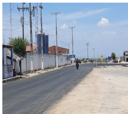
Foto 2 - Ocupação da faixa de domínio