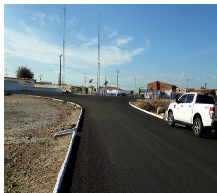
Foto 5 - Ausência de sinalização

A SIT deve empenhar-se na conclusão da sinalização vertical e horizontal da Rodovia, pois a pista encontra-se em pleno funcionamento e a falta de sinalização expõe os seus usuários ao risco de acidentes.