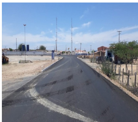
Foto 1 - Ocupação da faixa de domínio

Decorridos oito meses, entre as notificações administrativas e a data da vistoria realizada pela Auditoria, não houve mudanças na citada situação, estando as adjacências do corpo estradal irregularmente ocupadas e oferecendo perigo aos que nela trafegam.