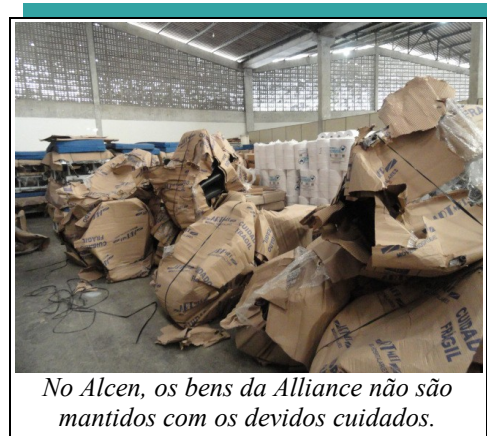
No Alcen, os bens da Alliance não são mantidos com os devidos cuidados.

Com base em tais informações, procedeu-se a visitas in loco às dependências do Alcen, onde constatou-se a precariedade no armazenamento, haja vista o reduzido espaço destinado à guarda dos itens ali alocados, bem como o predomínio improvisado do local, com equipamentos amontoados de forma desorganizada, impedindo inclusive o acesso da equipe de auditoria